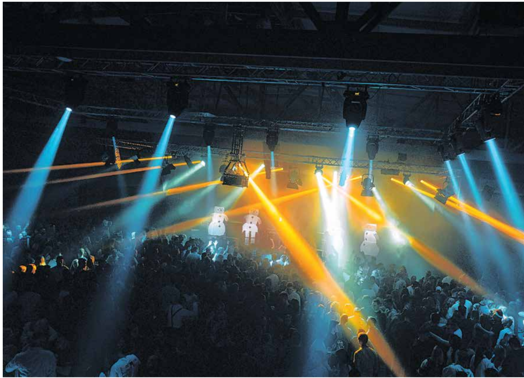
Von der Arena Hohenlohe in Ilshofen aus fahren nach dem Spiel Shuttlebusse zur X-Mas-Party im Hangar in Crailsheim.