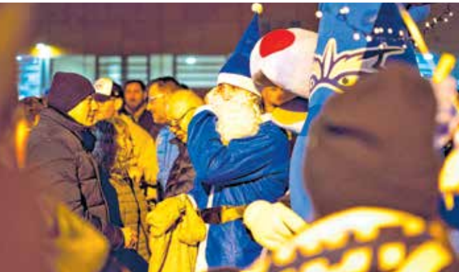
Im Winterdorf vor der Arena Hohenlohe gibt es unter anderem Glühwein, Punsch und Waffeln.